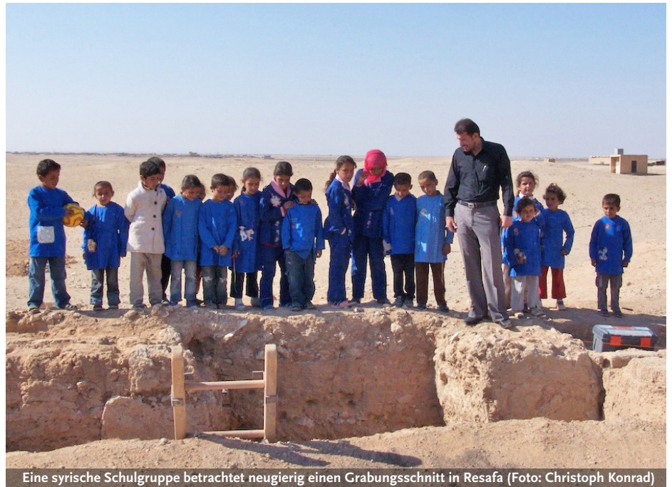
Eine syrische Schulgruppe betrachtet neugierig einen Grabungsschnitt in Resafa

Seitdem ihr vom DAI im Jahre 2006 die Projektleitung für die Resafa-Grabung übertragen worden ist, führt Dorothee Sack mit ihrem Team ein ehrgeiziges Bauforschungs- und Grabungsprogramm durch. Zweimal im Jahr, im März und im September, füllt sich das Grabungshaus mit Leben. 15 bis 25 Wissenschaftler und Studenten – Architekten, Archäologen und Geodäten – machen sich in