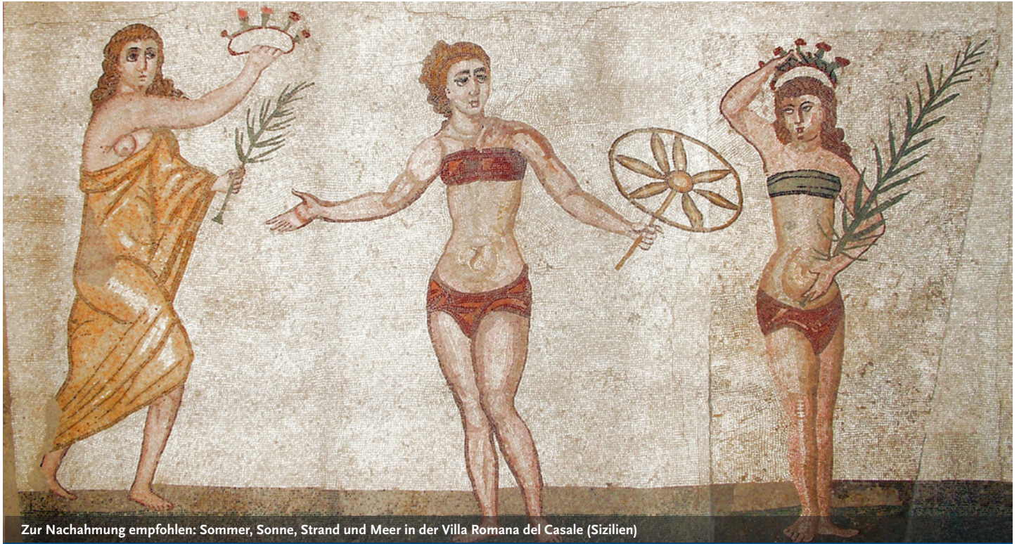
Zur Nachahmung empfohlen: Sommer, Sonne, Strand und Meer in der Villa Romana del Casale (Sizilien)

Seminarmitschnitte der CSG-II zum Nachhören