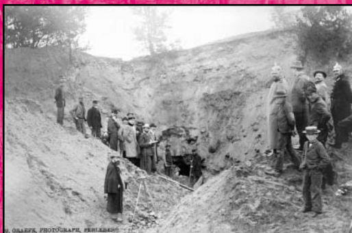
U. S. GEOLOGICAL SURVEY PHOTOGRAPH REEL 1000